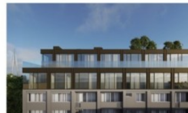
MIESZKANIE NR 1 PIĘTRO 5, 6