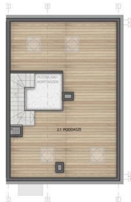
RZUT PODDASZA 2

PREZENTOWANE RYSUNKI ZOSTAŁY ZAŁĄCZONE W CELU PRZEDSTAWIENIA ROZKŁADU POMIESZCZEŃ I NALEŻY TRAKTOWAĆ JE JAKO SZCZEGÓLNE OŚCIEŻCZNE POWIERZCHNIE OKREŚLONE PODCZAS POMIARÓW POWYKOŃNAWCZYCH I MOGĄ ROZNIĆ SIĘ OD PODANYCH. ZMIANA POWIERZCHNI ZOSTANIE DOKONANA NA WARUNKACH OKREŚLONYCH W UMOWIE DEWELOPERSKIEJ. POWIERZCHNIA UŻYTKOWA LICZONA WG PN-ISO 9836:1997 ORAZ ROZPORZĄDZENIA MINISTRA TRANSPORTU, BUDOWNICTWA I GOSPODARKI MORSKIEJ Z DNIA 25 KWIETNIA 2012, "W SPRAWIE SZCZEGÓLOWEGO ZAKRESU I FORMY PROJEKTU BUDOWLANEGO"