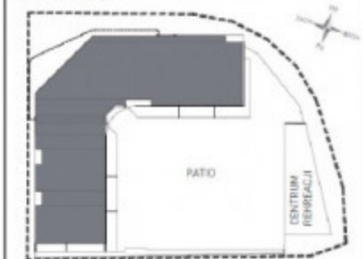
Plan sytuacyjny przedsięwzięcia deweloperskiego