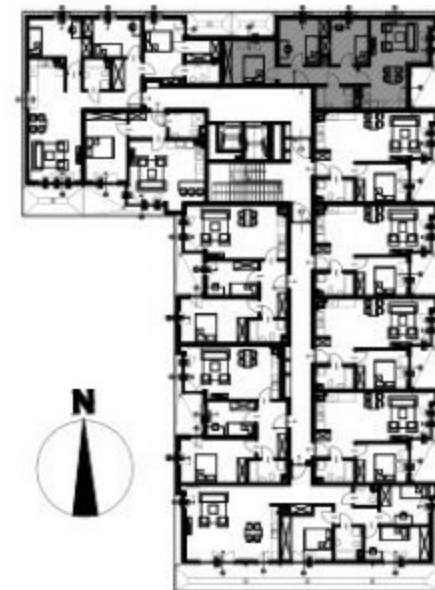
PLAN KONDYGNACJI, SKALA 1:500