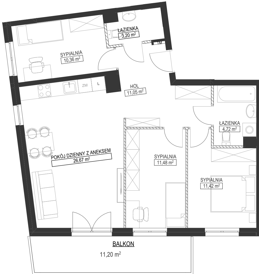
SCHEMAT LOKALU MIESZKALNEGO NA RZUCIE KONDYGNACJI

WARSZAWA - WŁOCHY, UL. WIKTORYN / BUDKI SZCZĘŚLIWICKIE