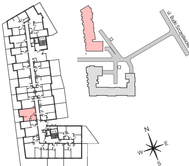
SCHEMAT LOKALIZACJI BUDYNKU